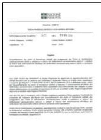
ACCRED. AG. BLSD