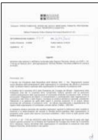
ISCR. ASSOC. P.C.