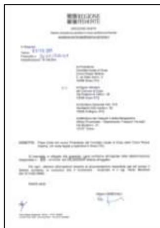
ISCR. ELENCO 42/92