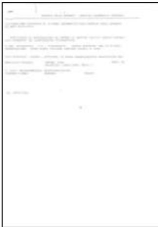
CERT. ATTRIBUZ. P.IVA

La Croce Rossa Italiana – Comitato di Susa è configurata ai sensi del vigente Statuto, rispondendo a quanto previsto dalla c.d. “Riforma del Terzo Settore”, come Organizzazione di Volontariato ed è iscritta all’anagrafe delle Organizzazioni Non Lucrative di Utilità Sociale (ONLUS), di seguito il riepilogo dei documenti relativi alla natura giuridica dell’Associazione, questi ultimi sono scaricabili integralmente sul sito internet istituzionale www.cri-susa.it nella sezione “Trasparenza”.