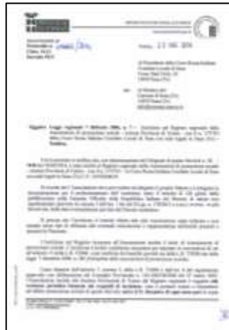
ISCR. REGISTRO A.P.S.